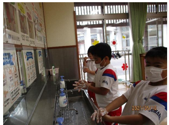
<食後の歯磨き、手洗いタイム>

長いコロナ禍の中、運動する機会が減り、子供たちの体力も落ちてきているように思われます。学校では、「ランランタイム」や体育科の学習を通して、目当てをもって運動することにこれからも取り組んでいきます。がんばっていることをほめて、励ましてください。