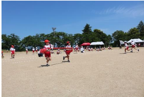
<3・4年生 わんぱくハリケーン>