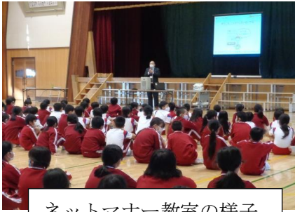
ネットマナー教室の様子

右のグラフのように、高学年ほど長時間インターネットを使用している児童が多いことが分かります。短い時間の利用であれば、気分転換等の効果もあると思われすが、3時間以上ゲームを続けるとゲーム依存の可能性が大きくなるという研究結果も報告されています。